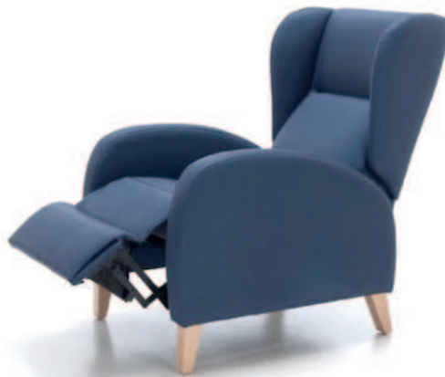
CORAL 2 Basismodell mit manueller Verstellung durch Körperdruck Basic model with manual adjustment