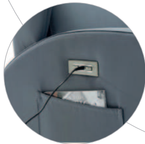
Li-On Batterie Li-On battery