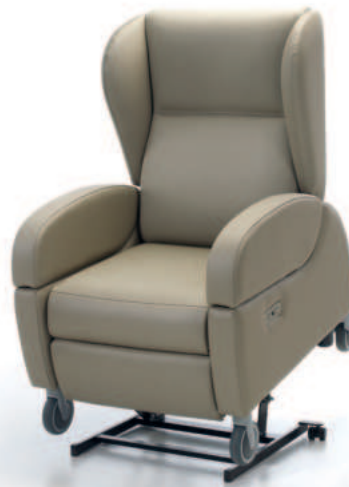
CORAL 6 mit elektrischer Verstellung (2 Motoren) und Aufstehfunktion with independent resting (two motors) and with stand-up system