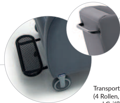
Transport kit (4 castors, footrest and handlebar)