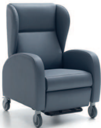
CORAL 4 mit elektrischer Verstellung (2 Motoren) with independent resting (two motors)