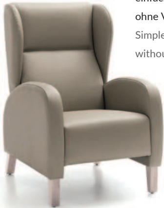
CORAL 1 einfacher Sessel ohne Verstellung Simple armchair without adjustment