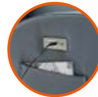
Li-On Batterie Li-On battery