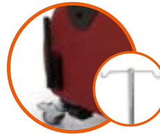
Infusionskit infusion kit