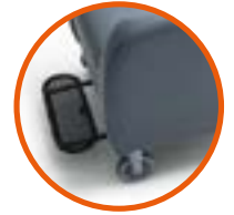
Transferkit 4 Rollen, Fußstütze und Griffbügel transfer kit 4 castors, footrest and handlebar