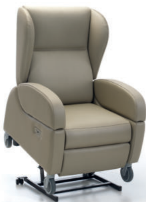
Coral 6 mit elektrischer Verstellung (2 Motoren) und Aufstehfunktion (Abb. mit optionalem Zubehör)