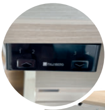
optionale elektrische Höhenverstellung