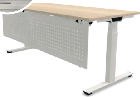
Schreibfisch Crew T mit Sichtblende