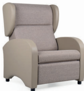
Coral Bariatric mit manueller Verstellung und einer Traglast von bis zu 200 kg