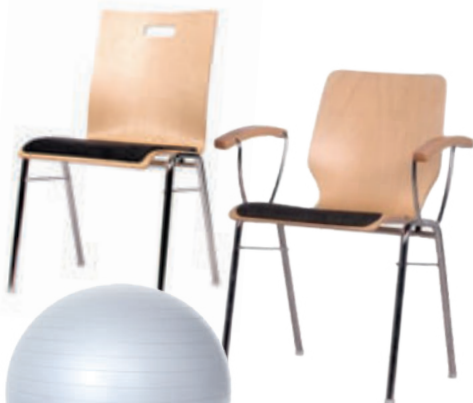
Therapiestuhl Kombisit, verschiedene Ausführungen

"Wir beraten Sie ausführlich bei der Einrichtung eines geeigneten Therapieraums."