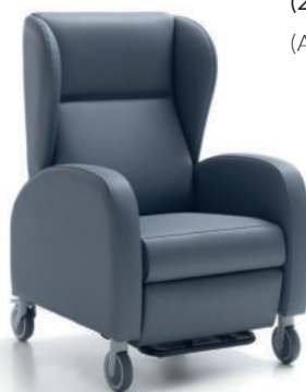
Coral 4 mit elektrischer Verstellung (2 Motoren) (Abb. mit optionalem Zubehör)