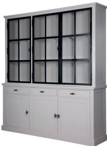
Vitrine Chalet 17861

Ob einzelne Sessel oder ganze Sitzlandschaften, lieber modern oder rustikal, bunt oder schlicht – Sitzmöbel sind auch im Pflegebereich breit gefächert und genügen dennoch allen Ansprüchen.